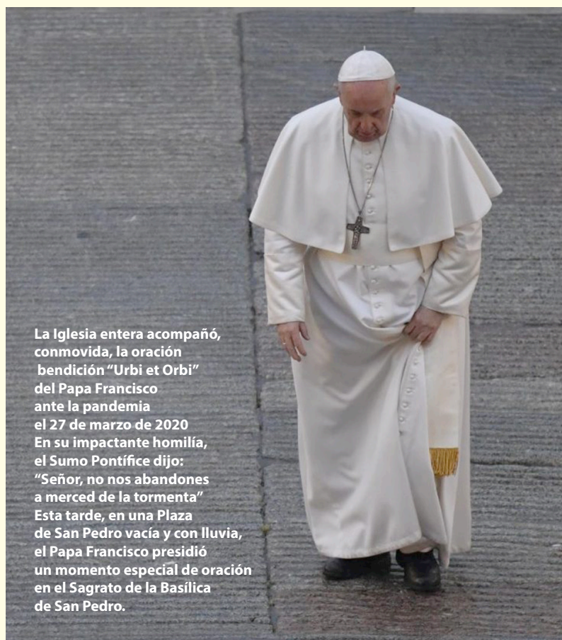
La Iglesia entera acompañó, conmovida, la oración bendición “Urbi et Orbi” del Papa Francisco ante la pandemia el 27 de marzo de 2020. En su impactante homilía, el Sumo Pontífice dijo: “Señor, no nos abandones a merced de la tormenta”. Esta tarde, en una Plaza de San Pedro vacía y con lluvia, el Papa Francisco presidió un momento especial de oración en el Sagrato de la Basílica de San Pedro.

En efecto, el Papa ha predicado con el ejemplo, viviendo con sencillez, buscando y acogiendo diversos puntos de vista. Él ha hablado de una Iglesia cuya armonía no es fruto de una suerte de uniformidad sino un canto sinfónico, polifónico, de donde brota riqueza y